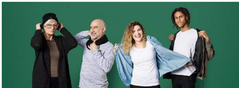
Bra för plånboken - bra för miljön.